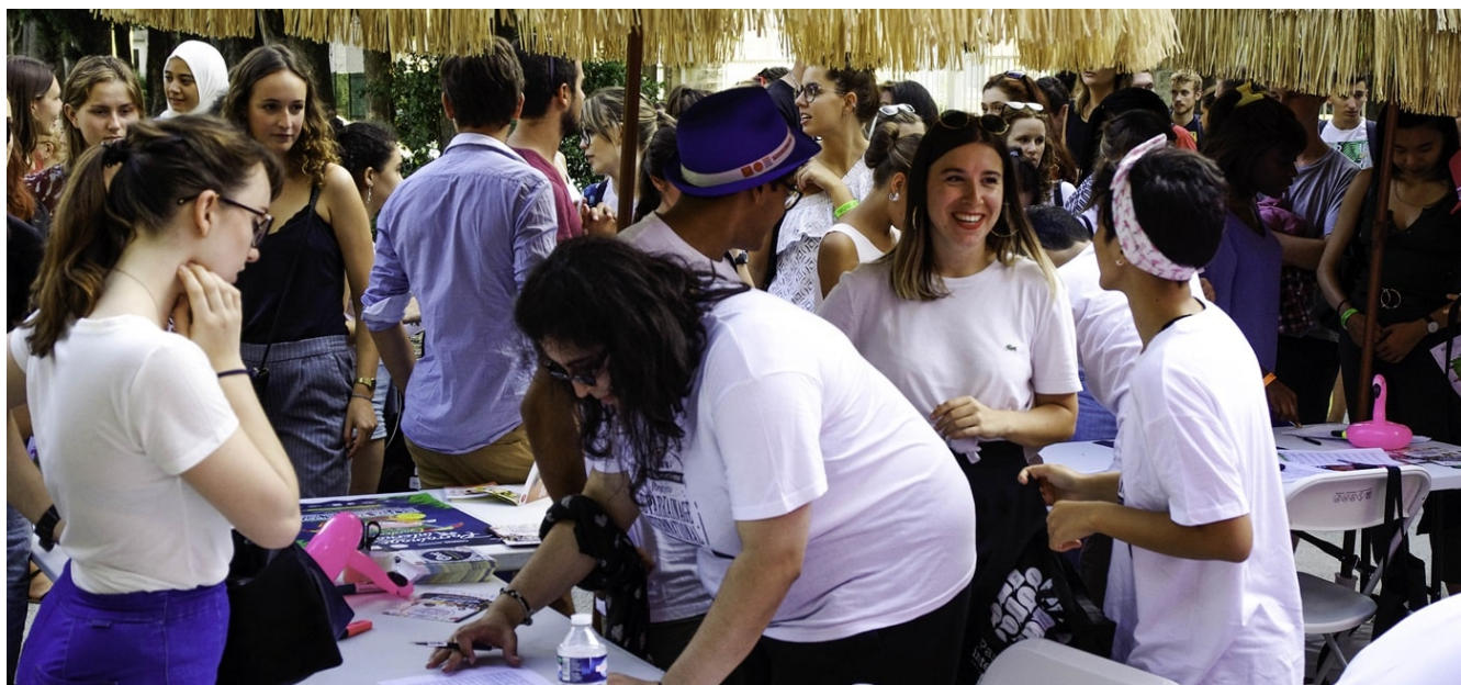
Garden Party du Parrainage International, Crous de Montpellier - Occitanie

avec la Cnam sur le portail Mes Services Etudiants, ainsi qu'à la formation des agents des Crous comme par exemple avec le ministère de l'intérieur sur les modalités de validation et de renouvellement des titres de séjour). Le partenariat du Cnous avec Campus France permet d'accueillir les boursiers du gouvernement français et de mandants étrangers dans les résidences universitaires des Crous. De même, les partenariats entre les Crous et les établissements d'enseignement supérieur soutiennent les coopérations internationales de ces derniers en améliorant l'accueil des étudiants internationaux qui relèvent de ces coopérations.