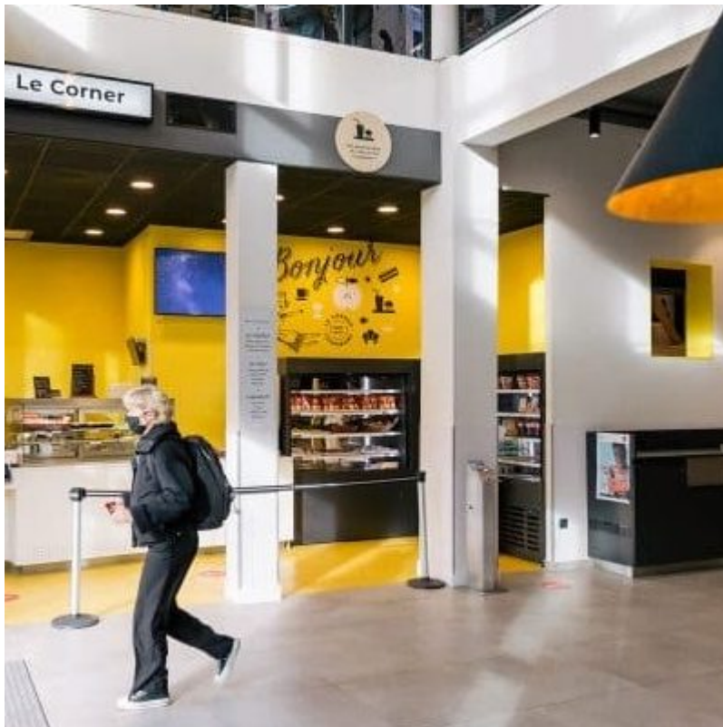
NOMBRE DE REPAS SERVIS DE 2021 À 2023 PAR TYPOLOGIE DE REPAS

Publié le 19 juillet 2024, Mis à jour le 25 juillet 2024