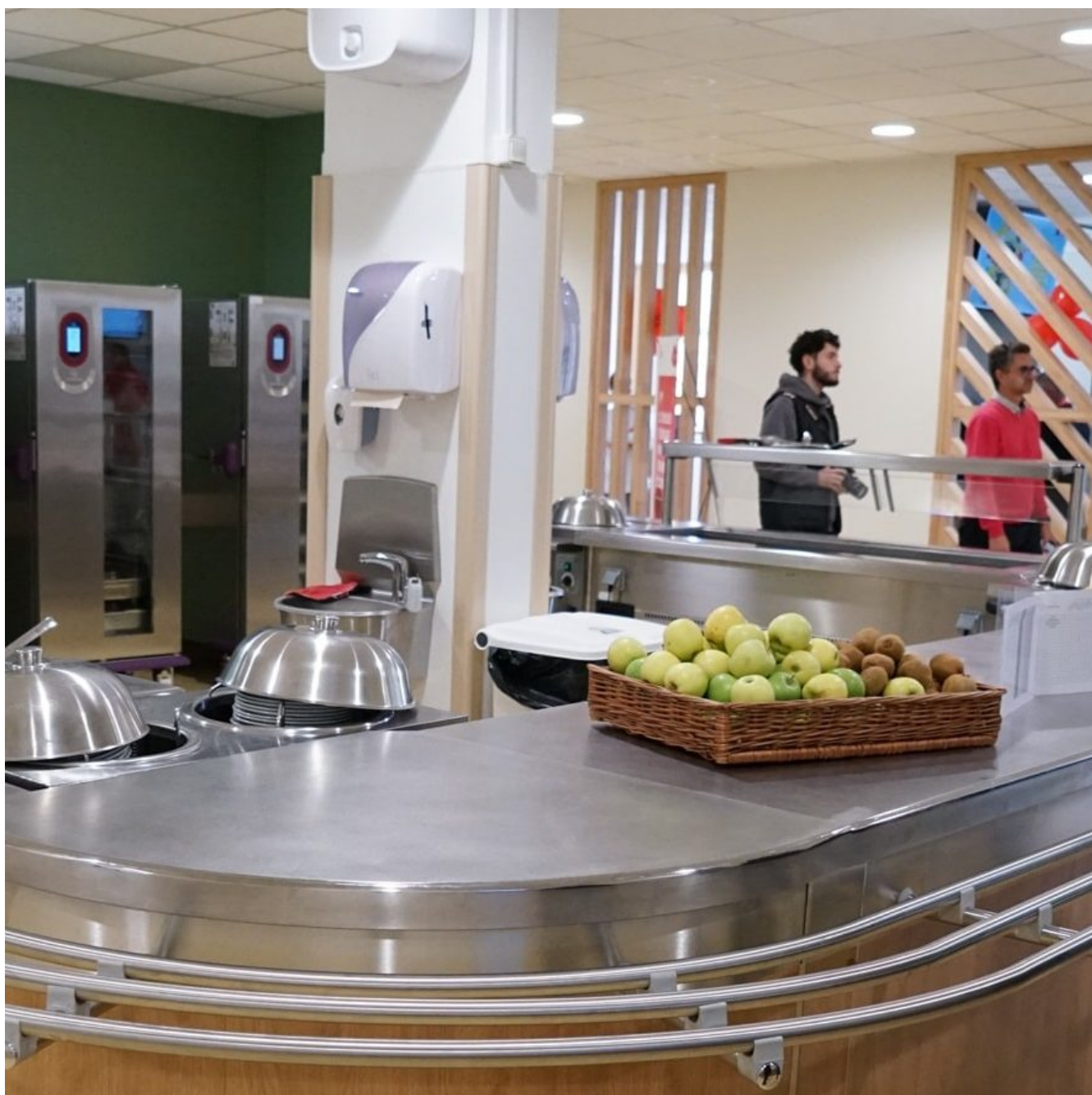
(S)pace' Champlain

Publié le 19 juillet 2024, Mis à jour le 25 juillet 2024