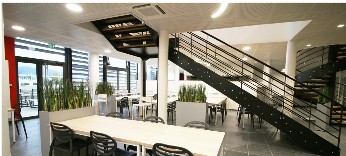
Cafétéria Le Saxo, Crous de Clermont - Auvergne

Publié le 19 juillet 2024, Mis à jour le 25 juillet 2024