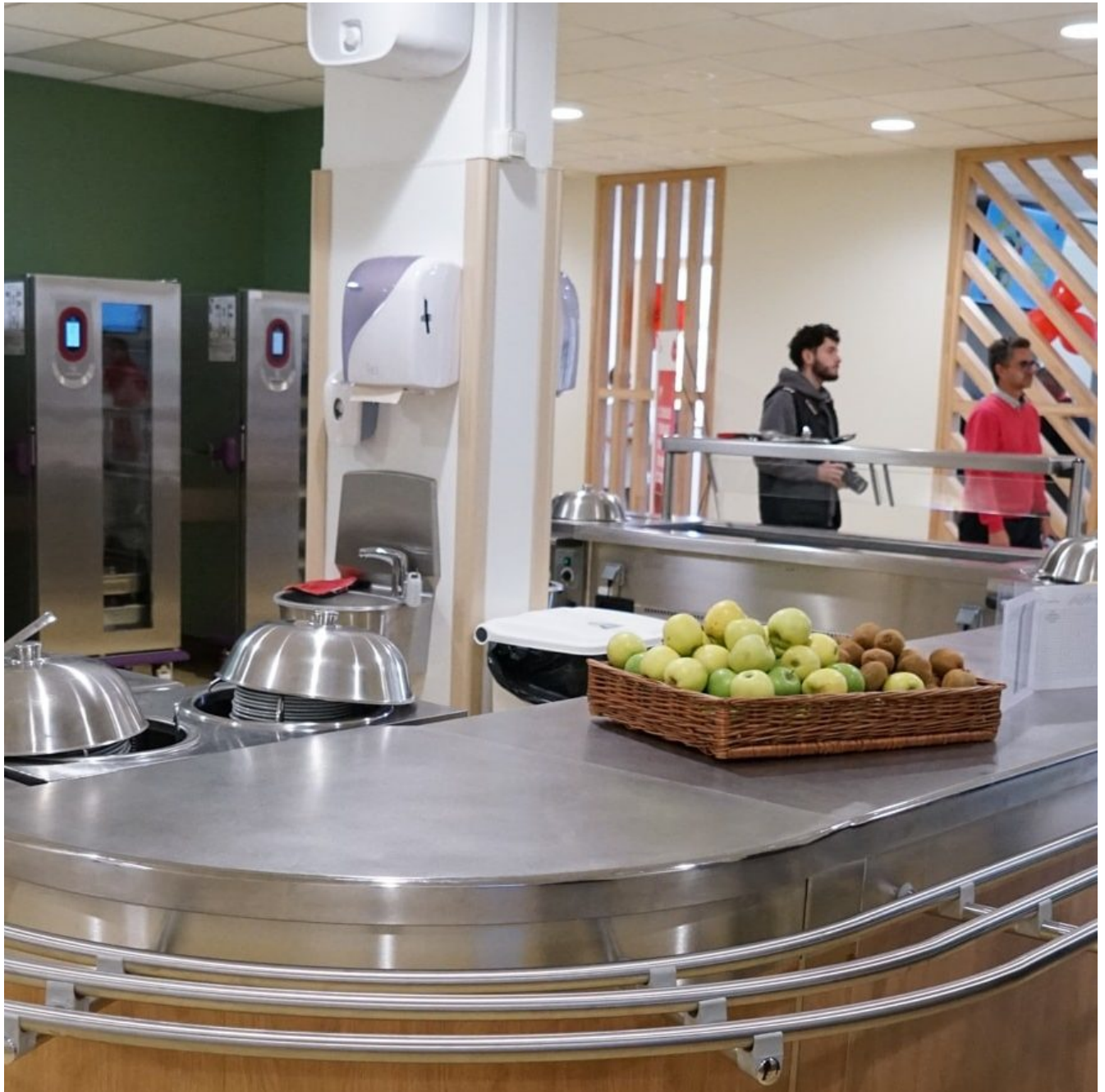
(S)pace' Champlain

Publié le 19 juillet 2024, Mis à jour le 31 juillet 2024