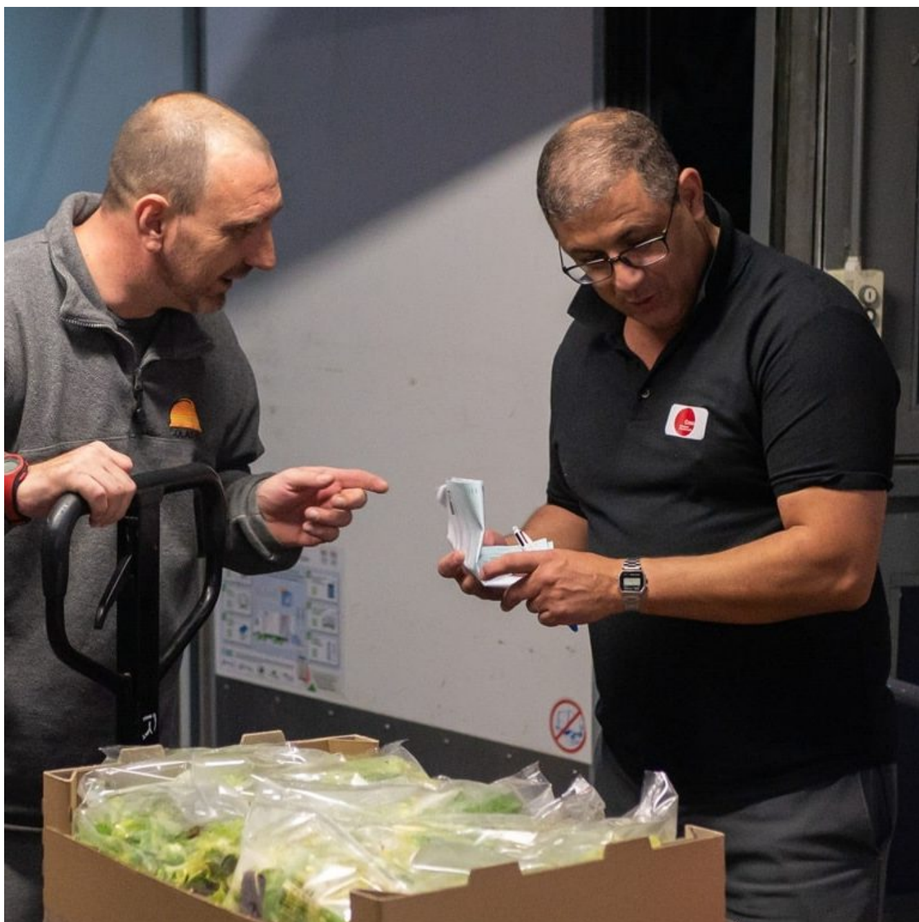
Crous de Bourgogne Franche - Comté LES ACHATS

Publié le 19 juillet 2024, Mis à jour le 25 juillet 2024