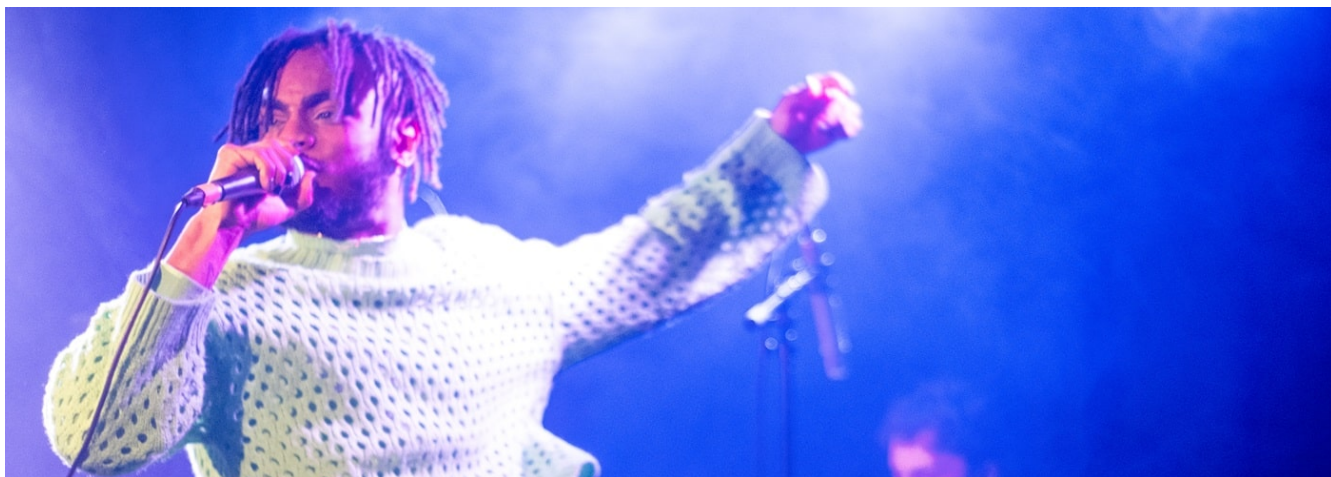
Demi-finale du concours de musique « Pulsations » - Crous de Bordeaux - Aquitaine

Le réseau des Crous relaie aussi le dispositif Départ 18:25, porté par l'ANCV, qui propose aux 18-25 ans une aide financière, sous conditions de statut ou de ressources pour leur permettre de partir en vacances. 12 431 jeunes boursiers (soit environ un tiers des partants) ont ainsi pu bénéficier du dispositif et de l'aide financière Départ 18:25.