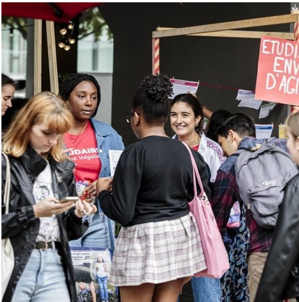
Free'stival, Crous de Lyon

Publié le 19 juillet 2024, Mis à jour le 1 octobre 2024