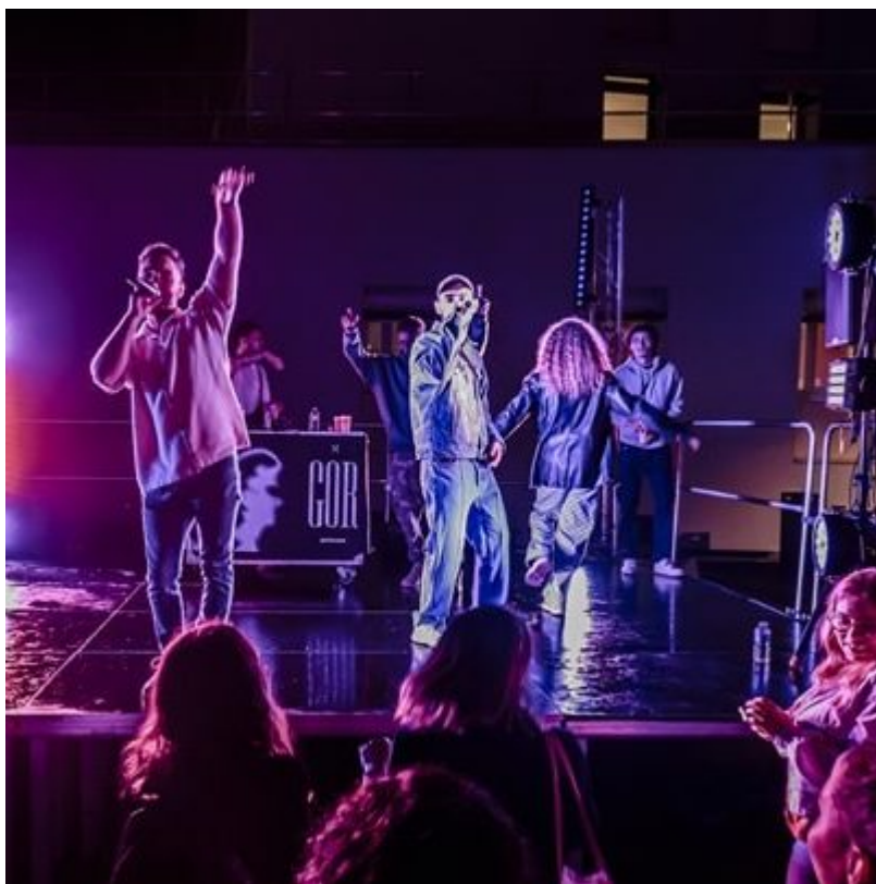
Free'stival - Crous de Lyon © Lionel Rault - 2023

Publié le 19 juillet 2024, Mis à jour le 1 octobre 2024