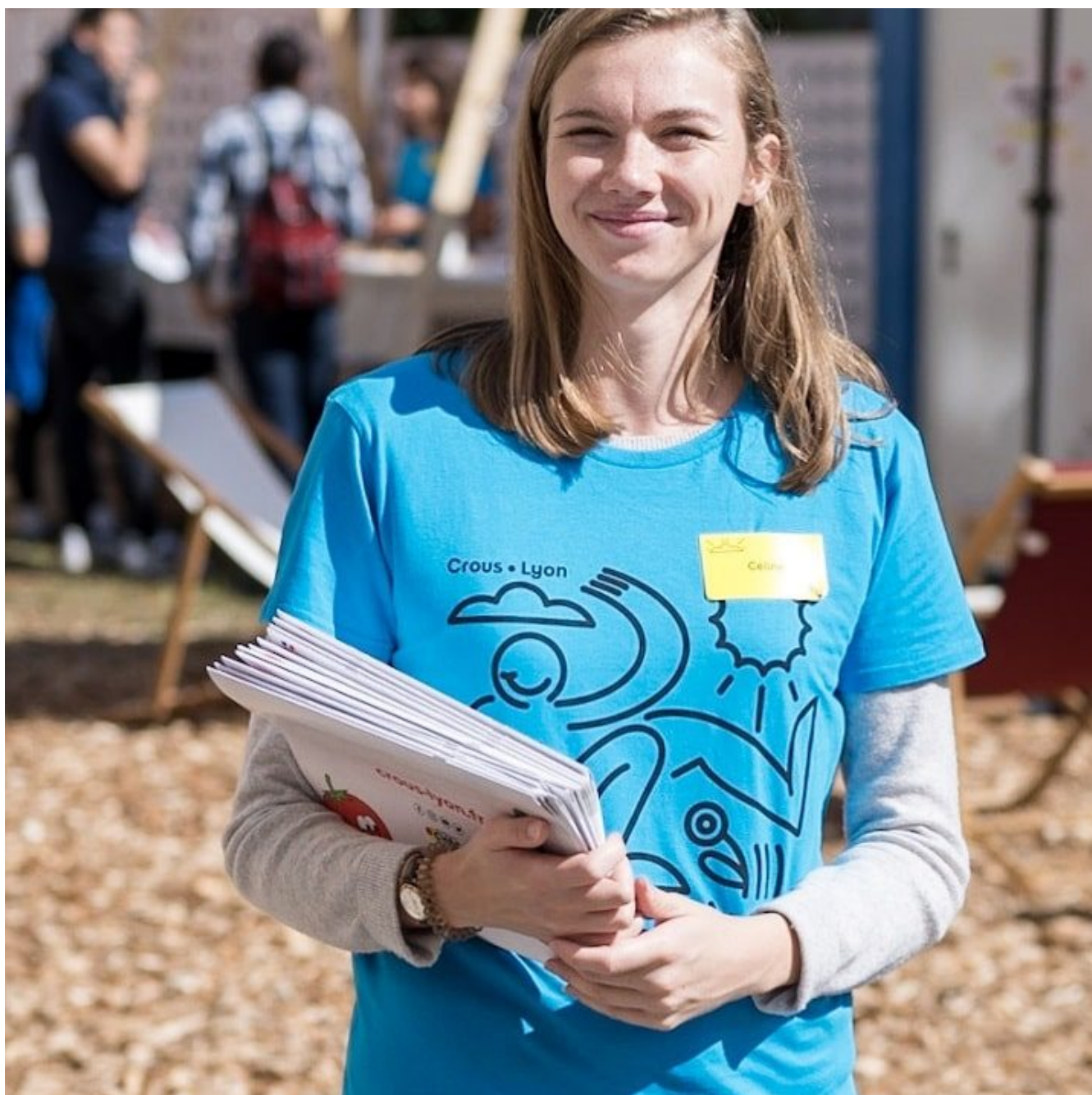
< Volontaire en service civique, Crous de Lyon

Publié le 19 juillet 2024, Mis à jour le 1 octobre 2024