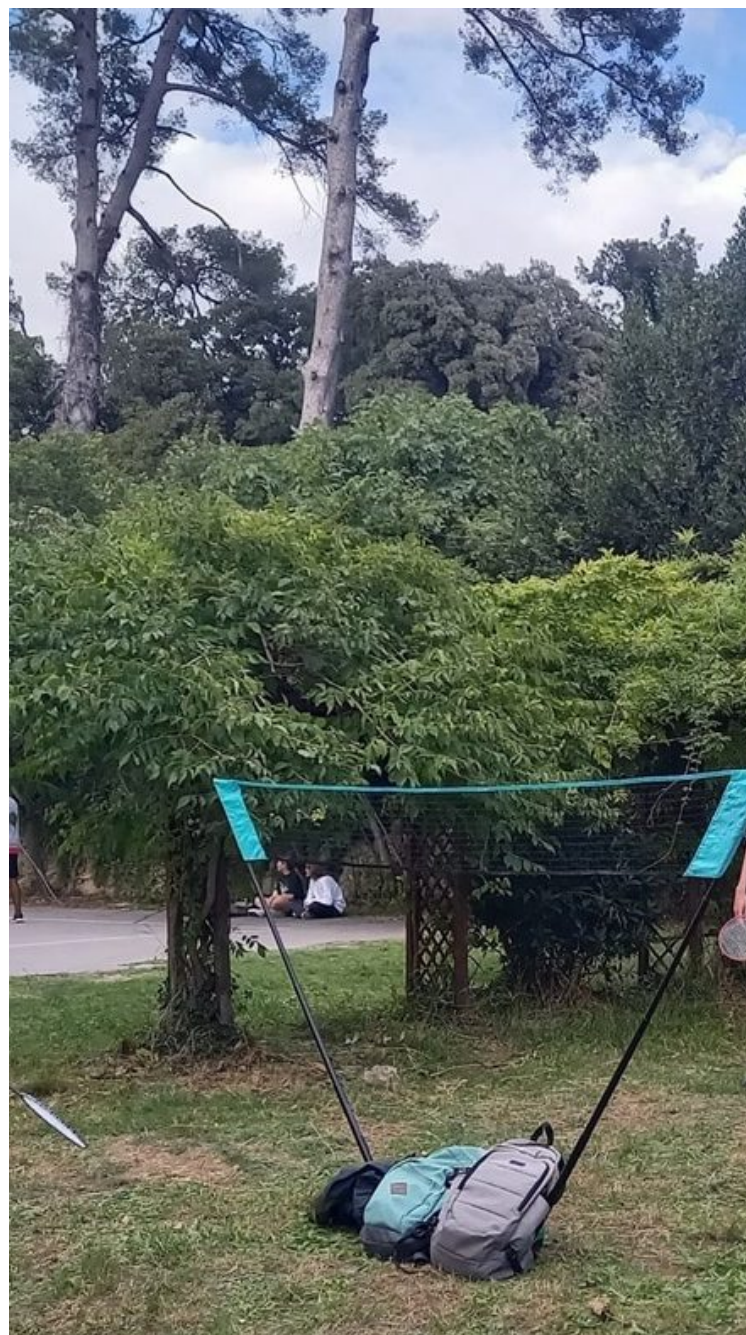
Crous de Montpellier - Occitanie

Publié le 19 juillet 2024, Mis à jour le 1 octobre 2024