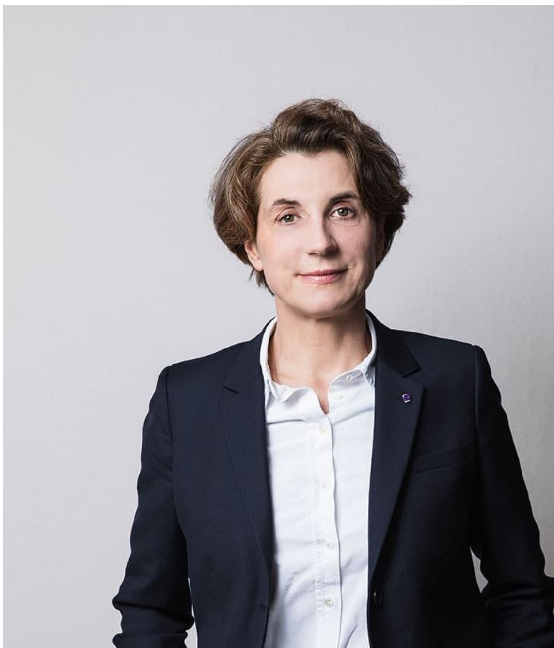
2024 L'ÉDITO

Publié le 10 juin 2024, Mis à jour le 12 décembre 2024