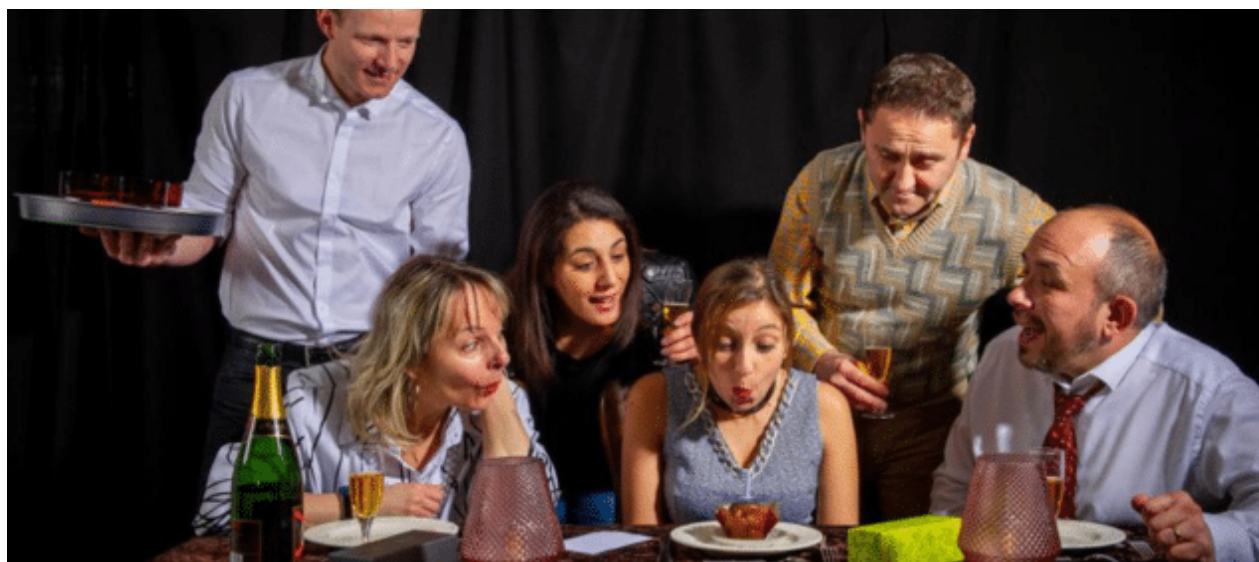
Théâtre et création avec la compagnie Crocs en Scène, Reims