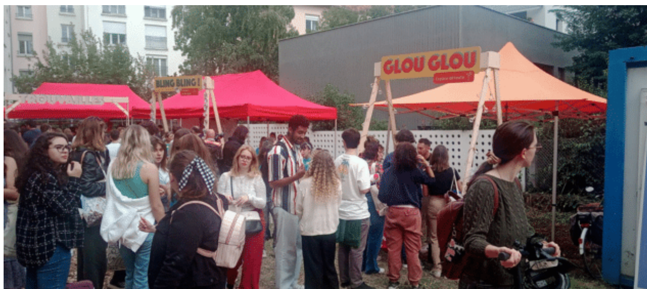
Le festival de la vie étudiante, Free'streval, Lyon

Publié le 23 avril 2023, Mis à jour le 24 mai 2024 Catégorie(s) : Les Crous